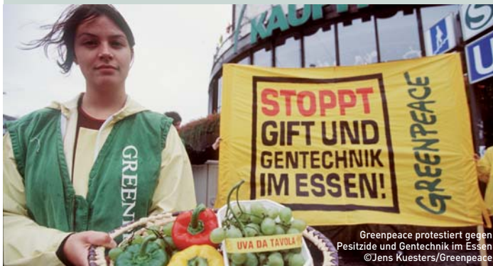
Greenpeace protestiert gegen Pestizide und Gentechnik im Essen