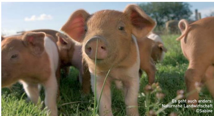
Es geht auch anders: Naturnahe Landwirtschaft